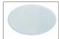
磨砂玻璃滤光片(标配)